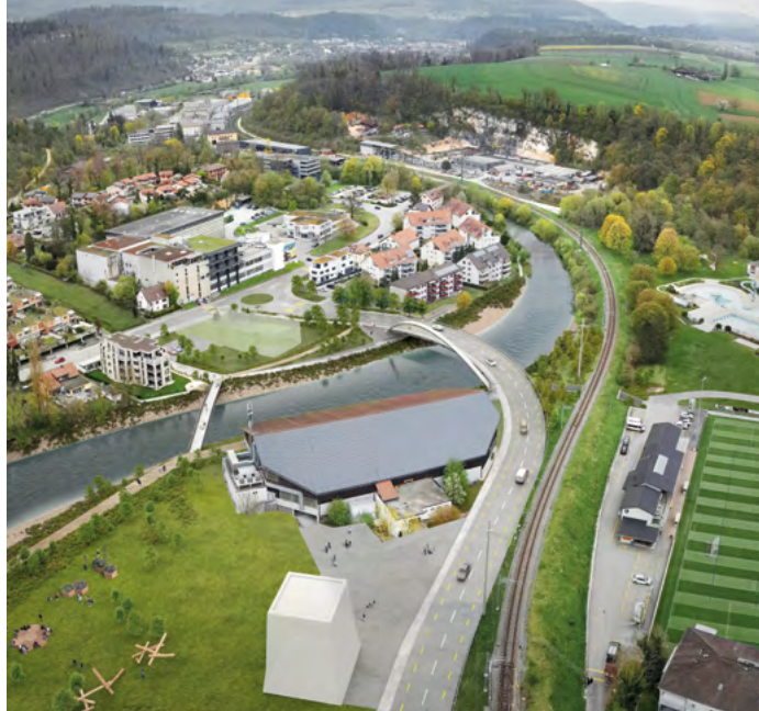
Streckenverlauf der Naubrücke bei einer Verlegung der Naubrücke hinter die Eishalle.